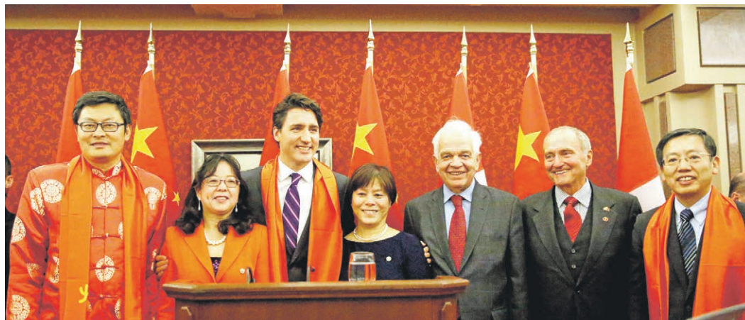
谭耕(左1)与太太(左2)跟加拿大总理杜鲁多(左3)在活动上。