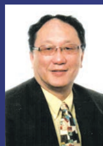
Pacific Evergreen Realty Ltd.

学费保证为有效期间由报名起始日为第一年 免费项目仅限于报名BC地产考牌全课程学员 详情请致电604.617.2230咨询或至公开课试听索取